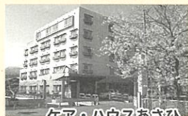
ケア・ハウスあさひ