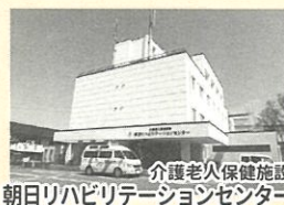
朝日リハビリテーションセンター