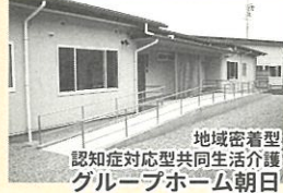
地域密着型認知症対応型共同生活介護グループホーム朝日