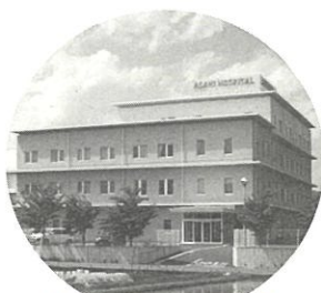
山田記念朝日病院

●地域の中核病院として 山田記念朝日病院 244-6411 外科・内視鏡外科・消化器外科・整形外科・脳神経外科・リハビリテーション科・内科・内科(糖尿病・代謝)・循環器内科・肛門外科・放射線科・眼科・婦人科