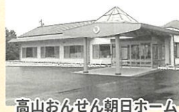
高山おんせん朝日ホーム