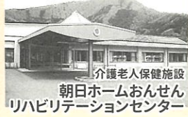
介護老人保健施設 朝日ホームおんせんリハビリテーションセンター