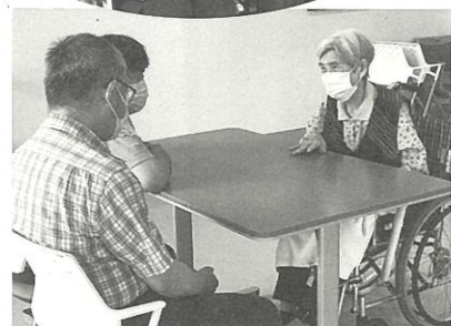
久々の面会に嬉しそうに話す皆さん。話はずみです。